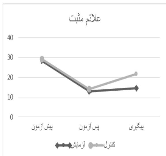
نمودار ۲: تغییر میانگین نمرات علائم مثبت در گروه های پژوهش در مراحل پیش آزمون، پس آزمون و پیگیری

مطابق نتایج تحلیل واریانس با اندازه گیری مکرر با عدم برقراری مفروضه کرویت و با استفاده از ضریب اصلاح Greenhouse-Geisser تفاوت معنی داری بین دو گروه از نظر تغییرات میزان علائم اختلالات طیف اسکیزوفرنی وجود نداشت ( F=0.83, P>0.05 ) و در کل نمره علائم اختلالات طیف اسکیزوفرنی کاهش معنی داری داشت ( F=1.81, P<0.001 ). همچنین بین زمان و تغییرات علائم اختلالات طیف اسکیزوفرنی برهمکنش وجود داشت ( F=27.04, P<0.001 ) بدین معنا که با گذشت زمان، روند علائم اختلالات طیف اسکیزوفرنی تغییر یافت.