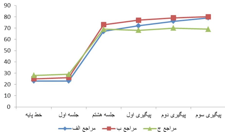
نمودار ۱: روند تغییر نمرات مراجعان در شاخص تمایل جنسی هالبرت (HISD)